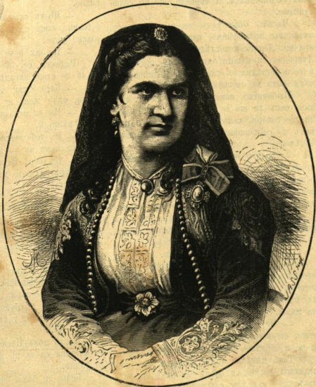
МИЛЕНА, КНЯГИНЯ ЧЕРНОГОРСКА.

— Ахъ! Не, не ти непрестанно го извиняванъ, но той ме не обича,